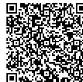
お問い合わせフォーム