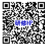
研修ホームページ