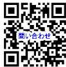
お問い合わせフォーム

*本研修は、神奈川県、横浜市、川崎市、相模原市、横須賀市の共同事業であり、株式会社ポピンズプロフェッショナルが委託を受けて実施します