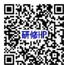
研修ホームページ

お問い合わせフォーム： https://poppins-education.jp/kosodateshien_kanagawa_contact/