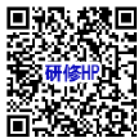
研修ホームページ