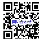
お問い合わせフォーム

* 当研修は、神奈川県、横浜市、川崎市、相模原市、横須賀市の共同事業であり、株式会社ポピズプロフェッショナルが委託を受けて実施します