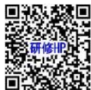
研修ホームページ

株式会社ポピンズプロフェッショナル 企画営業部 神奈川県子育て支援員研修係 TEL: 03-3447-5826 (受付: 平日9:00~17:00) FAX: 03-6704-5060 研修ホームページ: https://poppins-education.jp/kosodateshien_kanagawa/ お問い合わせフォーム: https://poppins-education.jp/kosodateshien_kanagawa_contact/