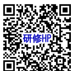
研修ホームページ