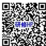
研修ホームページ