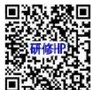
研修ホームページ

株式会社ポピンズプロフェッショナル 企画営業部 神奈川県子育て支援員研修係 TEL：03-3447-5826（受付：平日9:00～17:00） FAX：03-6704-5060 研修ホームページ：https://poppins-education.jp/kosodatashien_kanagawa/ お問い合わせフォーム：https://poppins-education.jp/kosodatashien_kanagawa_contact/