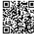
お問い合わせフォーム

* 本研修は、紋別市より株式会社ポピズプロフェッショナルが委託を受けて実施します。