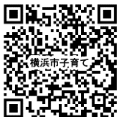
研修ホームページ