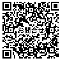
お問い合わせフォーム