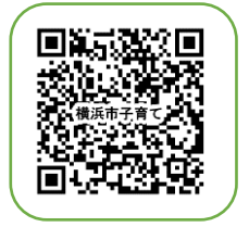
研修ホームページ

https://poppins-education.jp/kosodateshienin_yokohama/