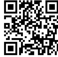
マイページログイン用

マイページログインURL : https://kenshu.poppins-education.jp/saitama/