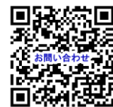
お問い合わせフォーム