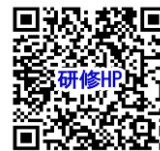
研修ホームページ

※本研修は、神奈川県、横浜市、川崎市、相模原市、横須賀市の共同事業であり、株式会社ポピンズプロフェッショナルが委託を受けて実施します。